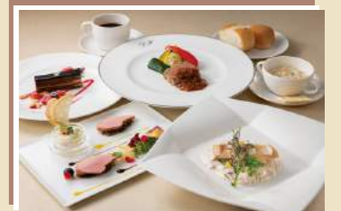
食事のコース料理(イメージ)