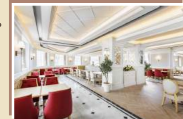
宝塚ホテルビュッフェ&カフェレストラン「アンサンブル」

料金 (おひとり) 会員・家族 10,000円 非会員 12,750円 ※1組4名まで ※非会員、家族は会員と同伴のこと